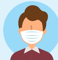
USO DE MASCARILLA