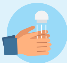
LAVADO DE MANOS